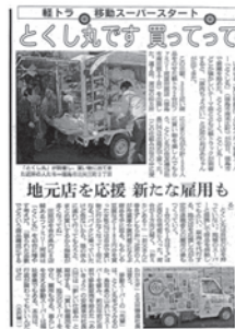
朝日新聞2月22日掲載