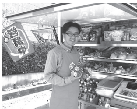
お得な移動スーパーをご近所に紹介してくださいね。

大きいもの…運ぶのにひと苦労ですが、とくし丸なら玄関まで(時には冷蔵庫の中まで?)お届けしちゃうますので楽々です。 そしてなによりお買い物の楽しみ。スーパーの商品の中でも「これがお薦め!」と思うものを選んでお届けしていますので、販売員と相談しながら、栄養を考えた「新しいおいしさの世界」がグーンと広がります。 こんなにお得な「とくし丸」、どうかお友達にも教えてあげてくださいね!