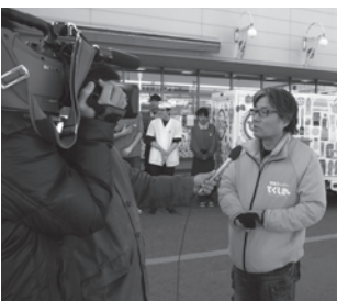
テレビのニュース番組も取材に！