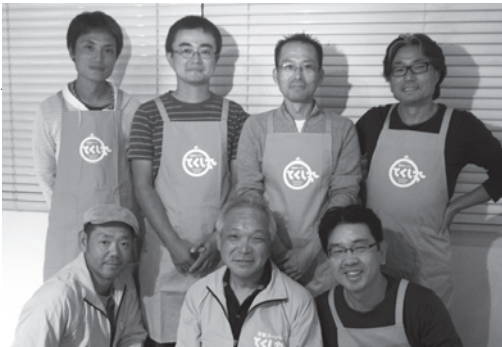
いつも笑顔のとくし丸スタッフです！商品の注文や、販売先の紹介など、お気軽にお電話ください。

あなたの町でも、もう顔なじみになったスタッフもいますよね。とくし丸スタッフは、オレンジ色のジャンパーやエフロンを身につけて、明るく元気にあなたの買い物をお手伝いします。商品の注文もできるの